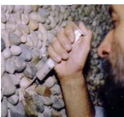
Výzdoba stěn tzv. Kamínkových místností a ukázka jejich restaurování