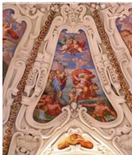
Únos Evropy na nástěnné malbě v kopuli centrálního sálu