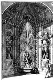
Lasturová grotta. J. van den Nypoorta, 1691