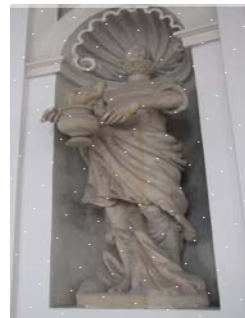
Alegorie Zimy od sochaře M. Mandíka ze 17. let 17. století