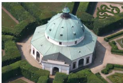
Současný vzhled stavby po úpravách v 19. a 20. století

V průběhu roku 2011 jsou v Rotundě také prováděny odborné průzkumy s cílem získat nové informace o historii této unikátní raně barokní stavby. Průzkumy jsou spolufinancované z programu Podpora pro památky UNESCO Ministerstva kultury České republiky. Jejich náplní je především provedení podrobného zaměření Rotundy, stavebně historický průzkum stavebních konstrukcí objektu, dendrochronologický průzkum jeho dřevěných konstrukcí a rešerše dostupných archivních pramenů vážící se k objektu Rotundy. S výsledky výzkumů se budete moci seznámit v rámci komentovaných prohlídek zahrady.