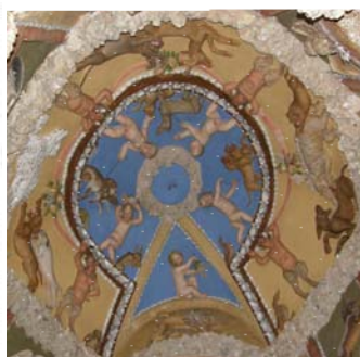
Umělecká výzdoba tzv. Lasturové grotty, současný stav