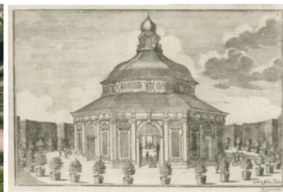
J. van den Nypoort, Zahradní pavilon v Květné zahradě, 1691