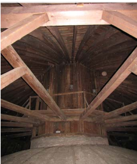
Dřevěná konstrukce krovu Rotundy