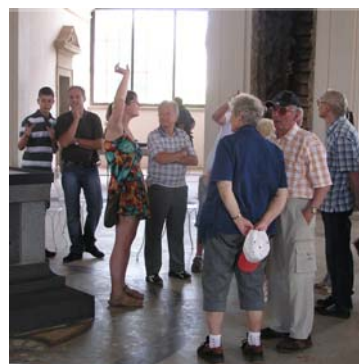
Komentované prohlídky stavby s průvodcem